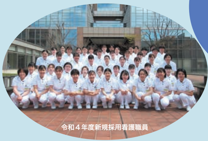
令和4年度新規採用看護職員