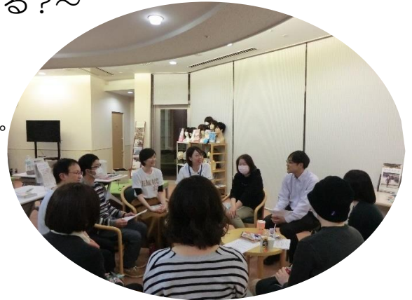
※参加者の許可を得て写真を使用しています

病気や治療費のこと、仕事や恋愛、結婚、他の人はどうしてる?どう考えている?こんなのがあるといいなあなど、若いがん患者さんならではの「あるある」話を一緒にしてみませんか。