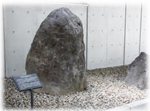
がんセンター前にある平岡山の石