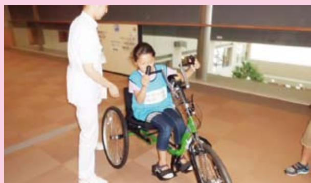
(リハビリテーション室での車いす体験の様子)