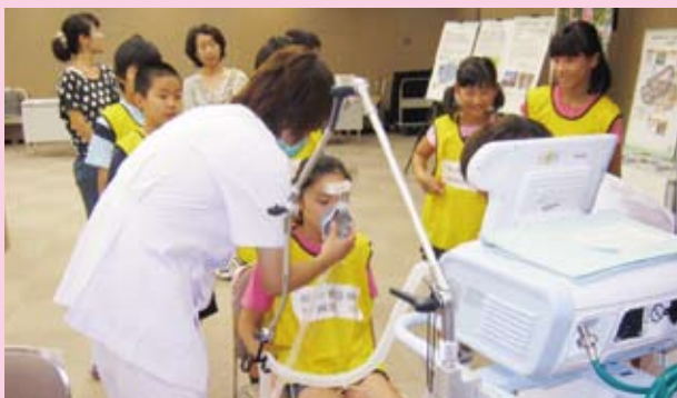
(医療機器使用体験の様子)