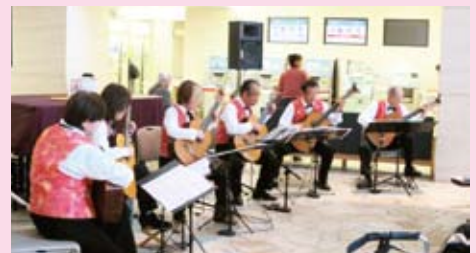
10月31日のボランティアコンサートの様子