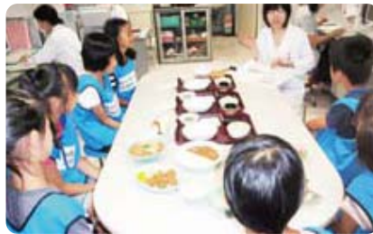
病院食について学習