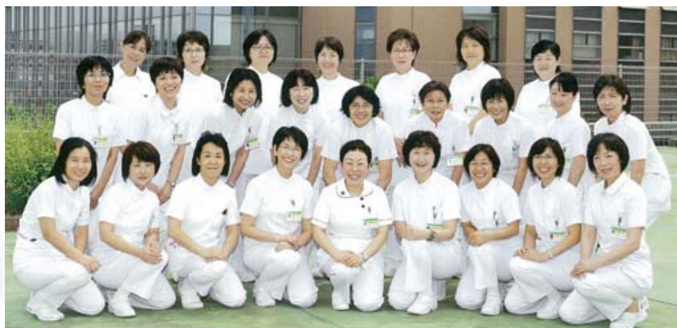
めざす看護に向い続ける師長会 (部長、次長、師長が集合)