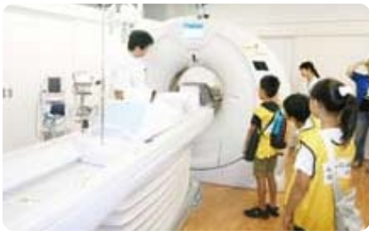
CT装置の見学・説明

当日は、手術衣を着てみたり、人工心肺装置を操作してみたりと、みんな普段したことがない体験をし、貴重な夏休みの思い出になったと思います。将来、この子供たちの中から当院で働く医師や看護師、医療技術者が生まれることを期待しています。