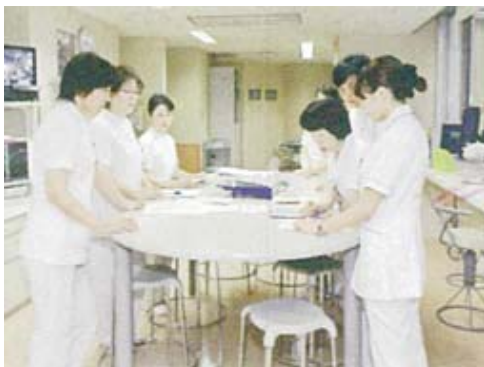
危険予知トレーニングカンファレンス

ヒヤットした事例をもとにカンファレンスを行い、医療安全に対する意識を高めています。